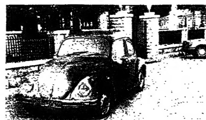
سيارة خاصة السيد عزيز وردة أصيبت بعمل الانفجارات التي حصلت في مزرعته